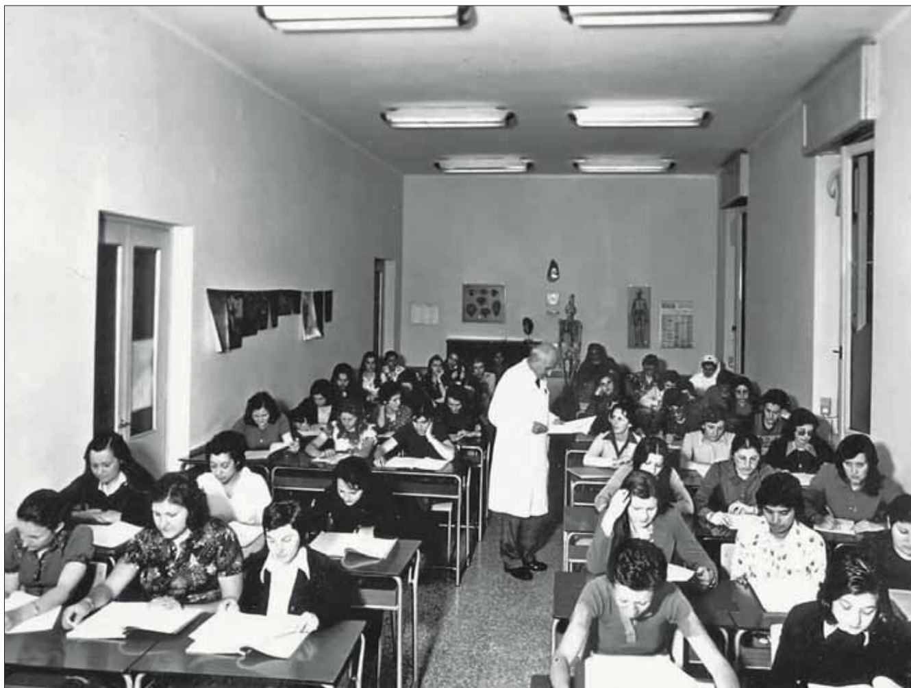
1° corso per Infermieri Professionali di durata triennale (1974)