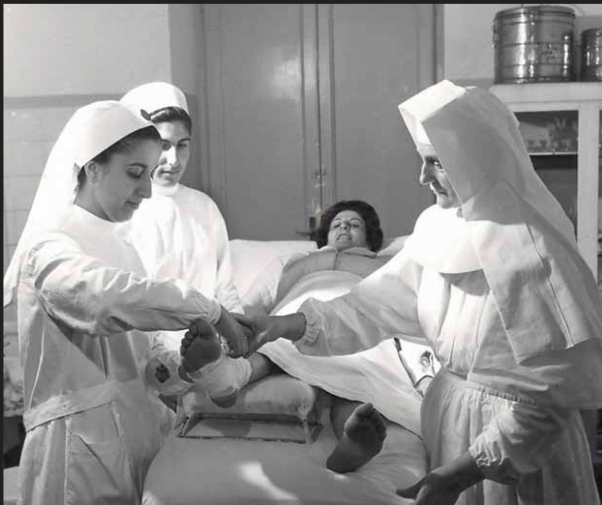
Fasciatura del piede