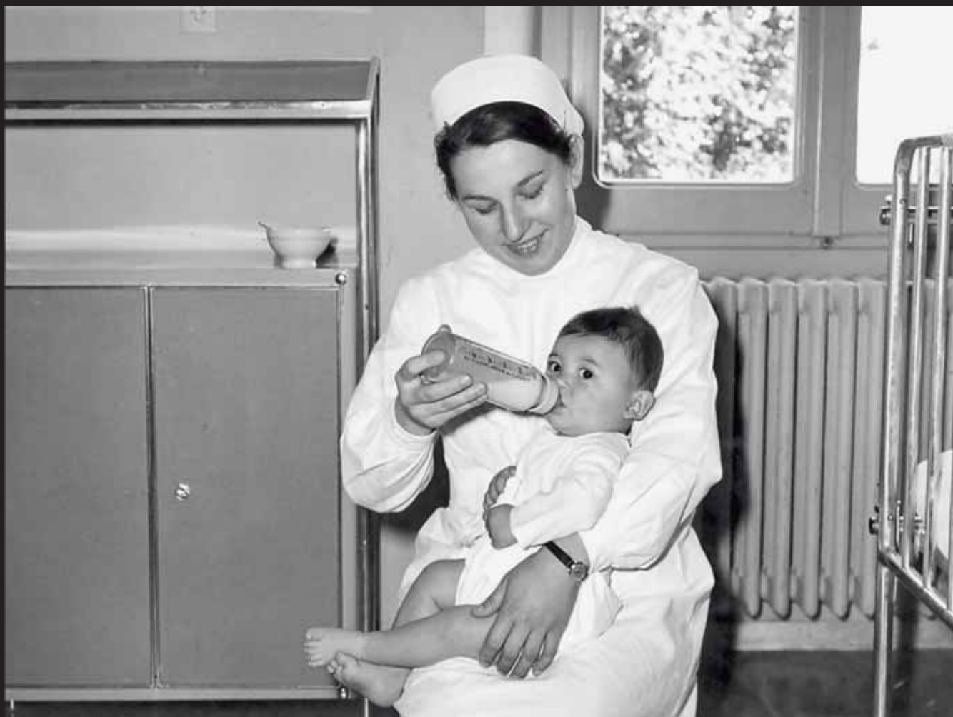
Alimentazione del lattante