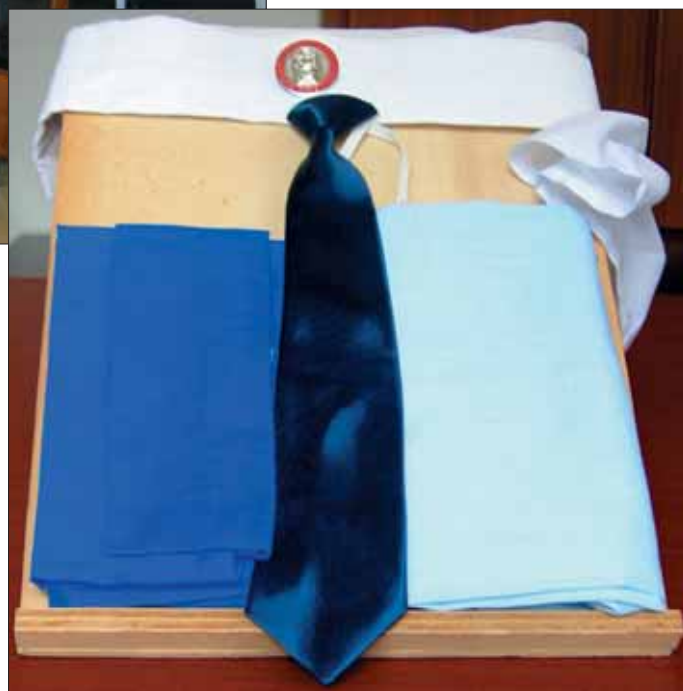
Abbigliamento delle Allievs