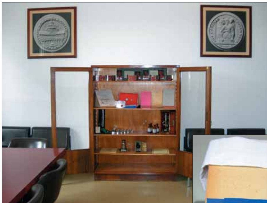
Alcuni ricordi conservati nella Sala di Rappresentanza