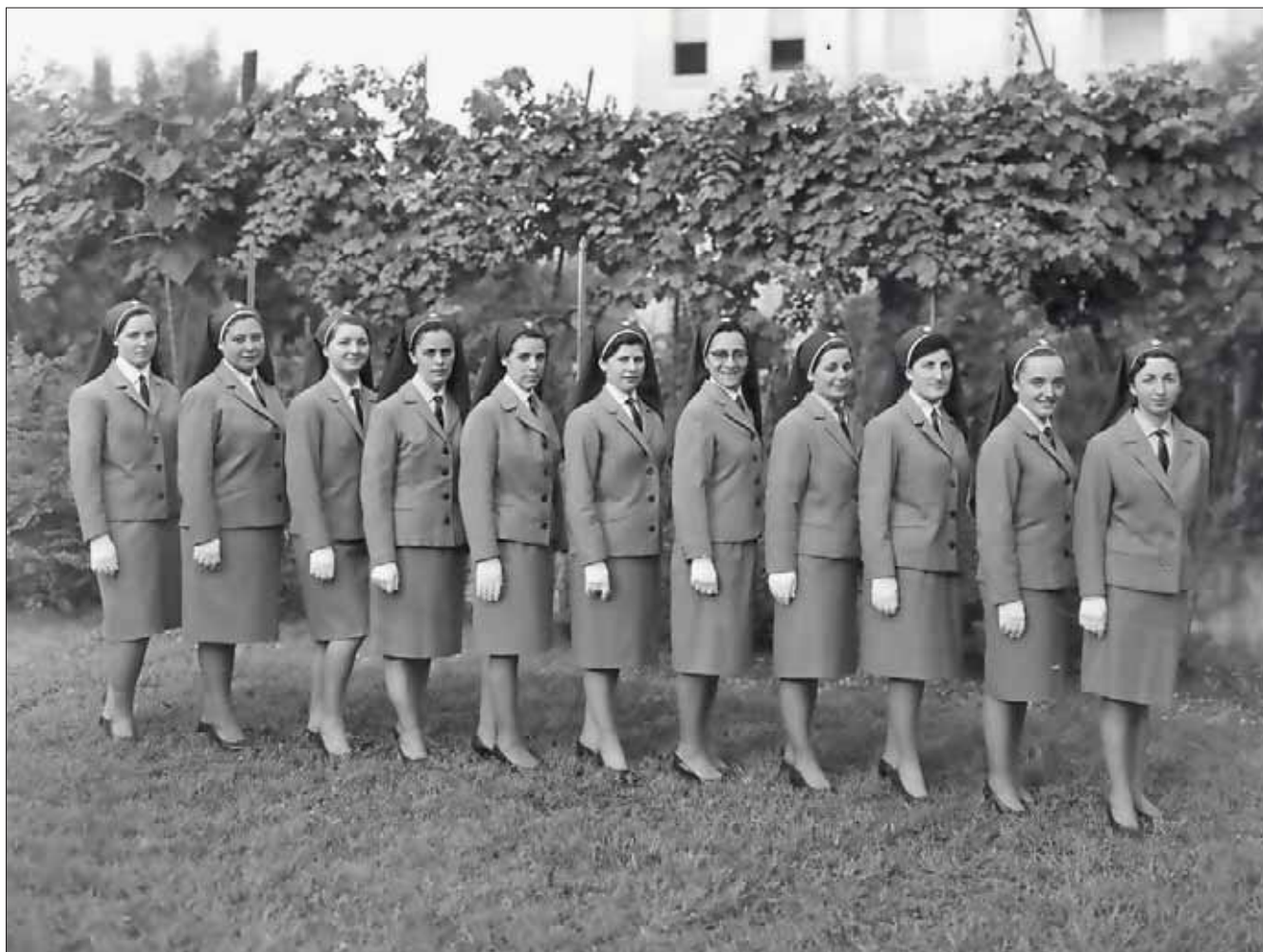
Allieve in uniforme di rappresentanza religiosa primaverile/autunnale