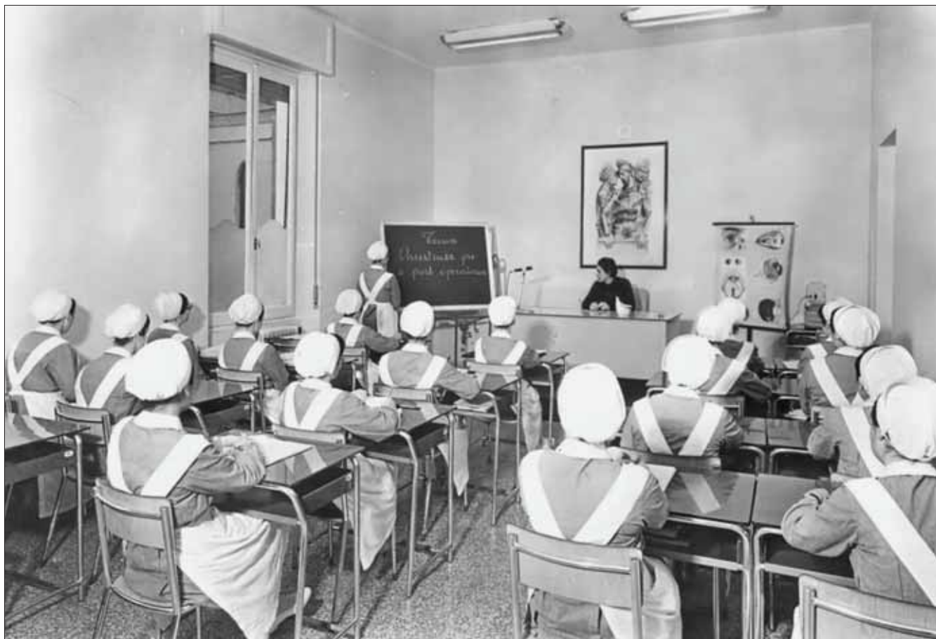
Lezione in Aula