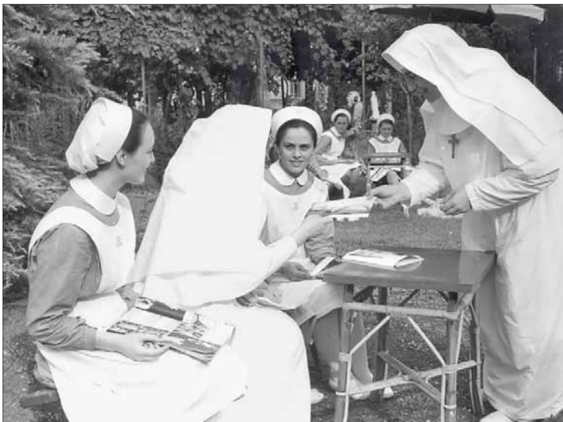
Rari momenti di relax nel Giardino della Scuola Convitto