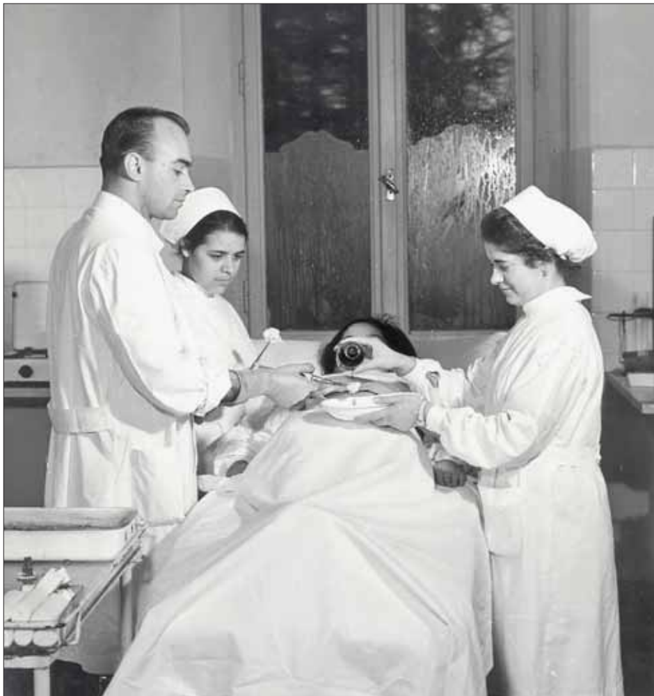
Attività in Sala Medicazione