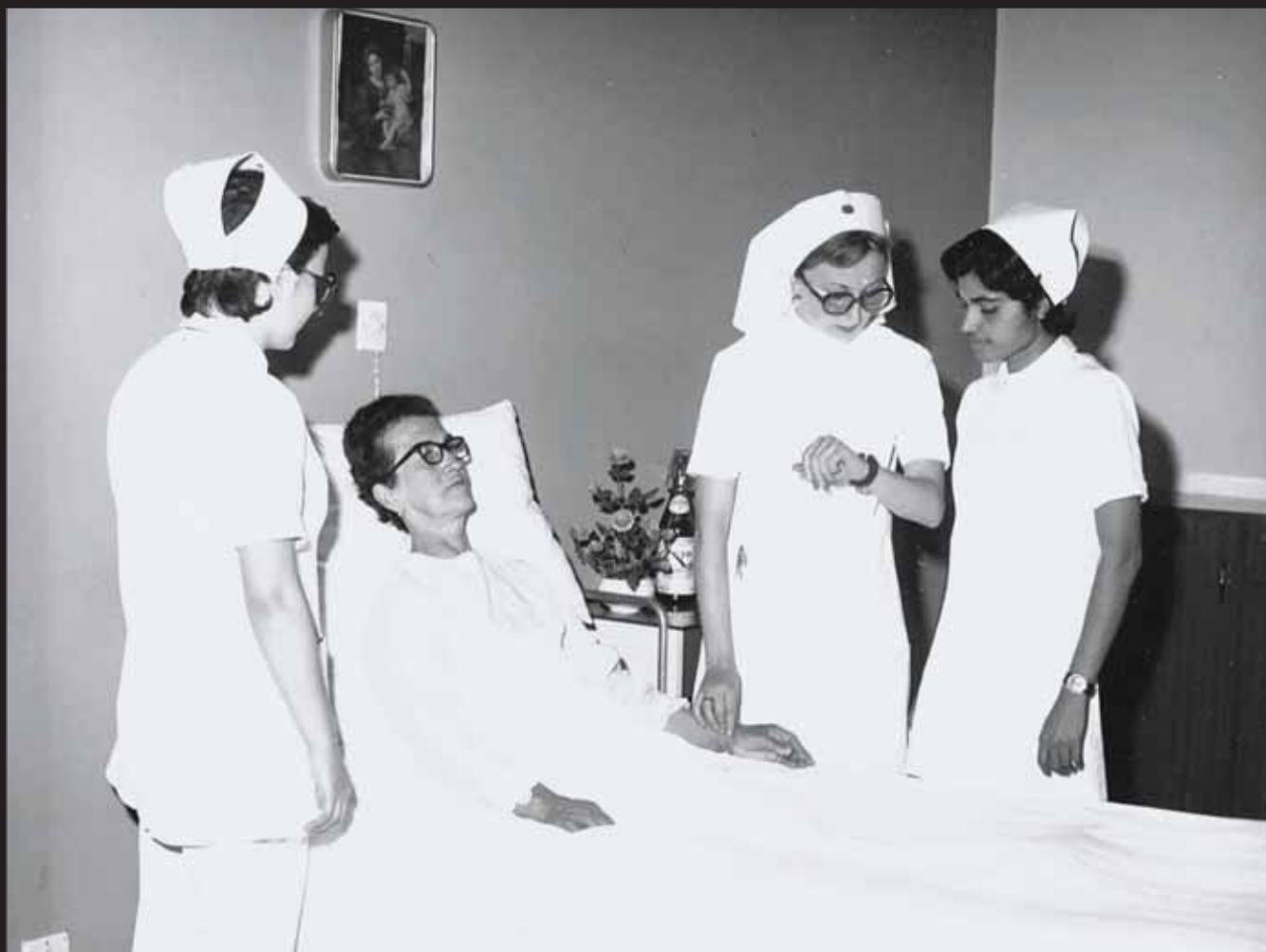
"Guida di Tirocinio" insegna alle Allieve a rilevare la frequenza cardiaca