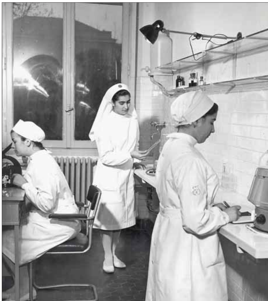
Attività di Laboratorio