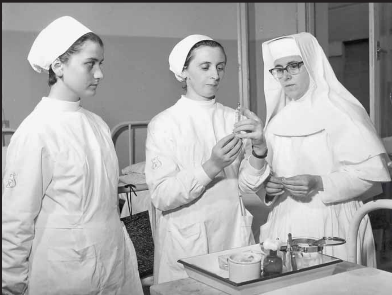
Preparazione terapia intramuscolare