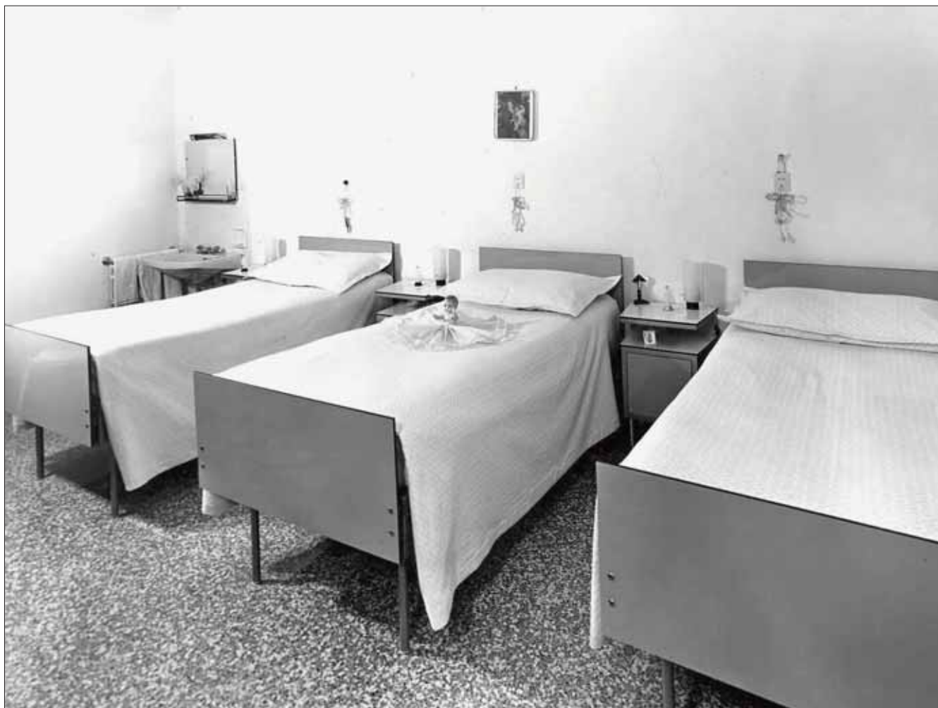
Camera per le Allieve interne della Scuola Convitto