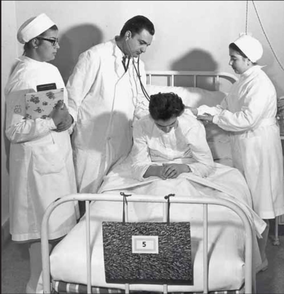
Assistenza alla visita medica