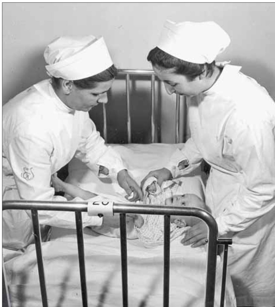
Allieve durante il cambio del pannolino