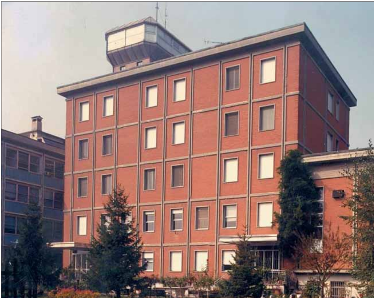
Nuova sede della Scuola per Infermieri Professionali dal 1975