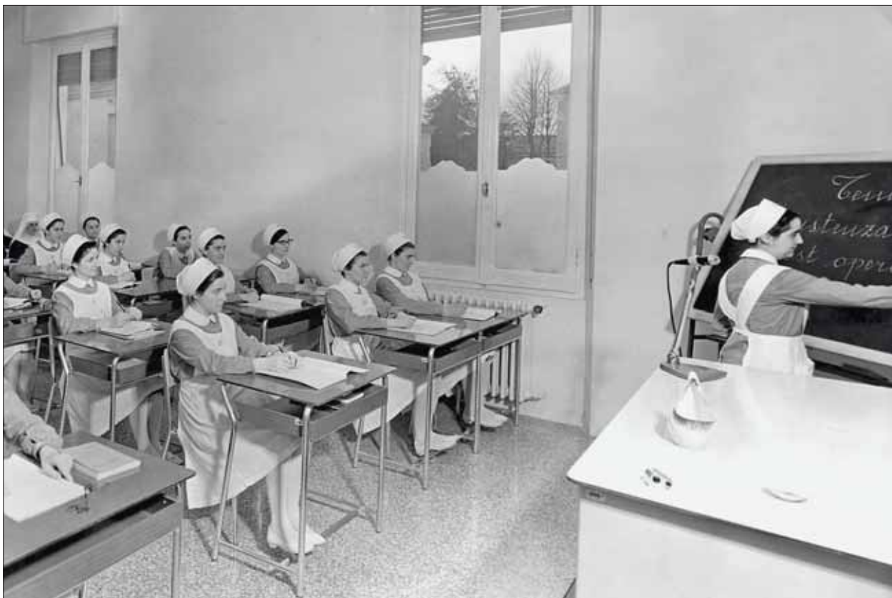
Lezione in Aula