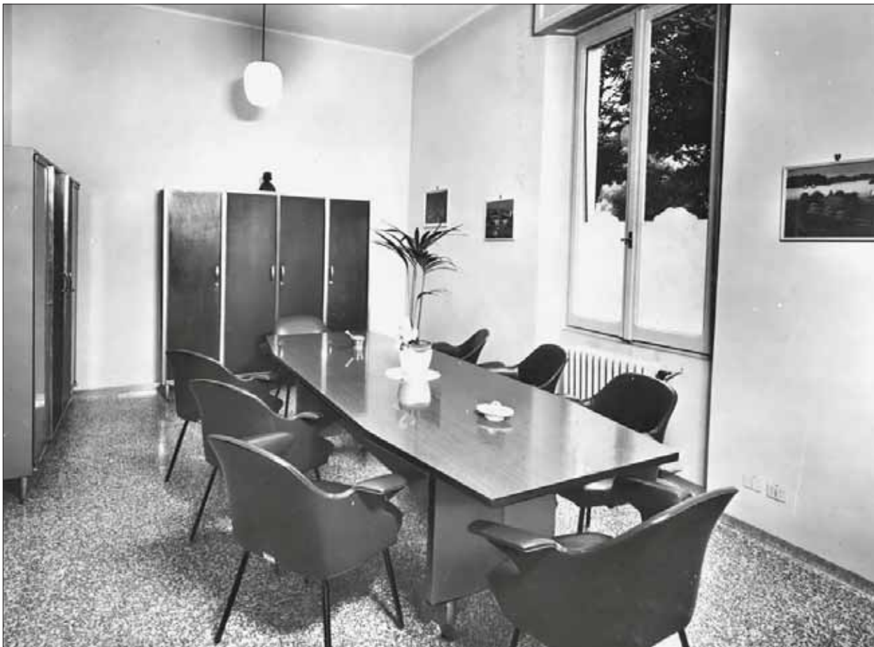
Sala Riunioni della Scuola Convitto