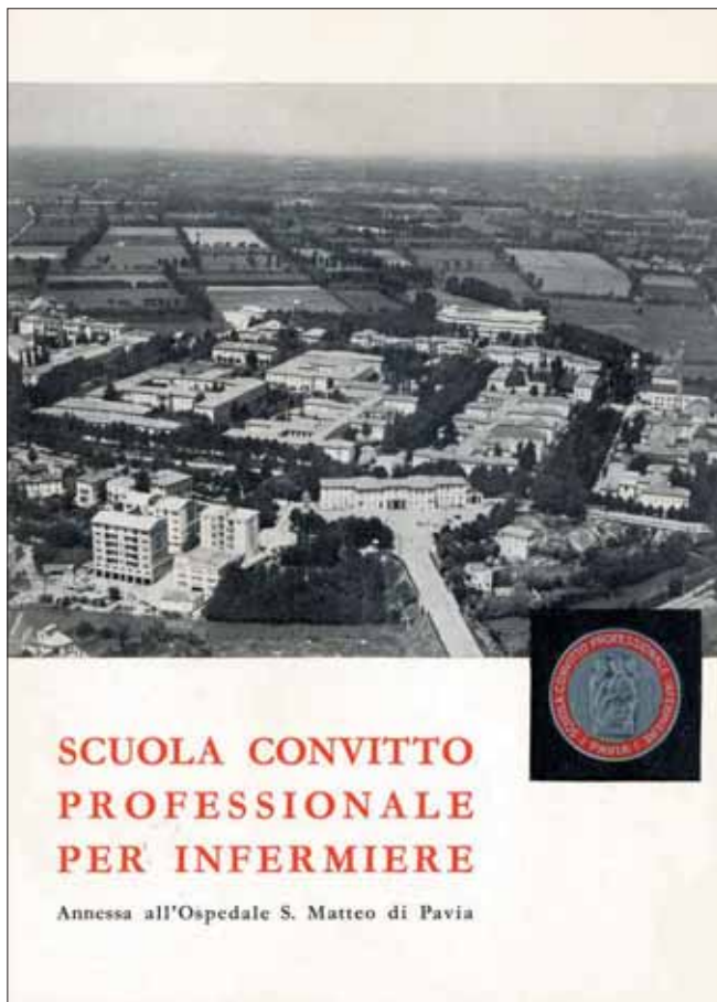
Opuscolo di presentazione della Scuola Convitto per Infermiere