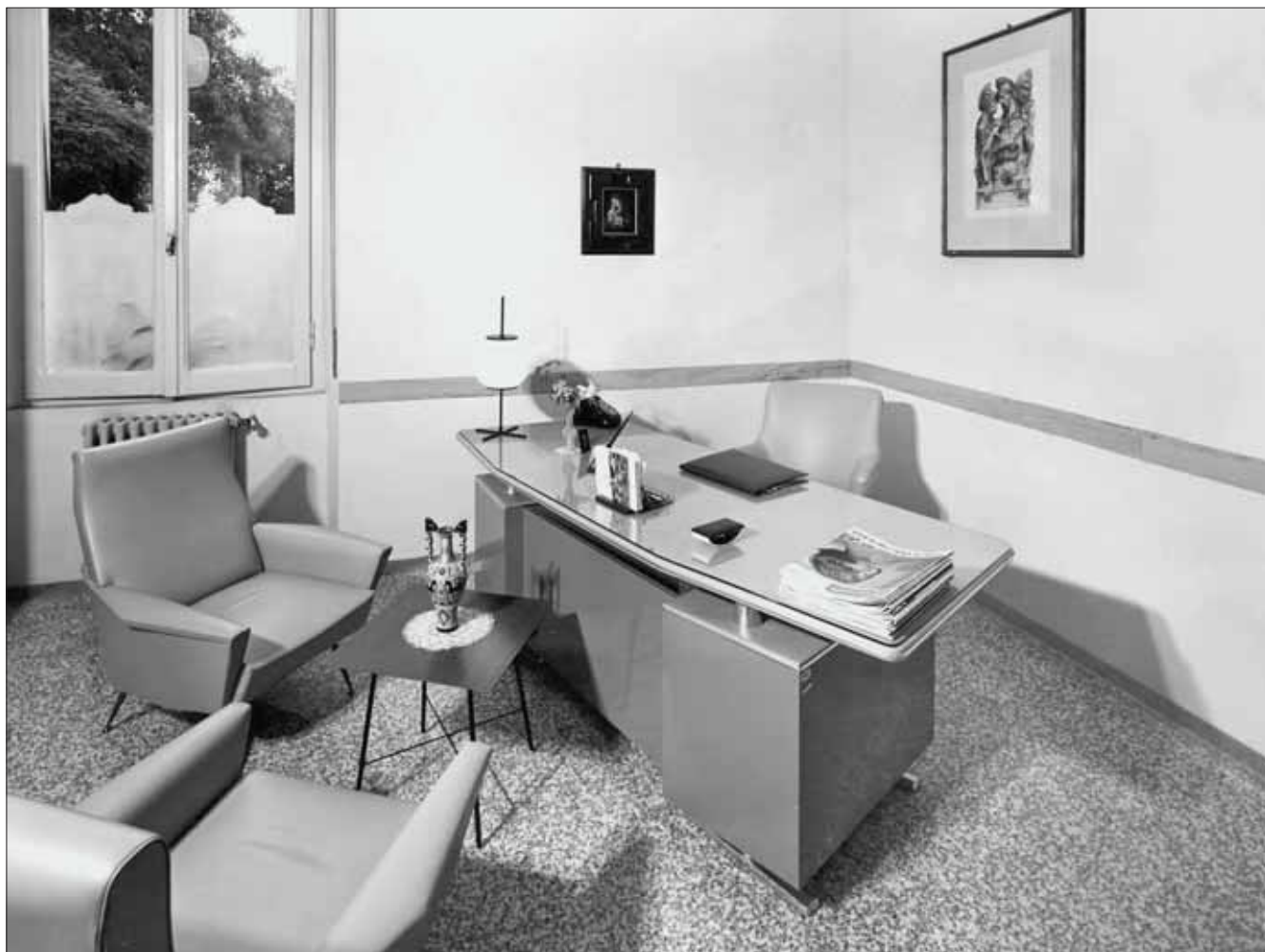
Ufficio della Direttrice della Scuola Convitto