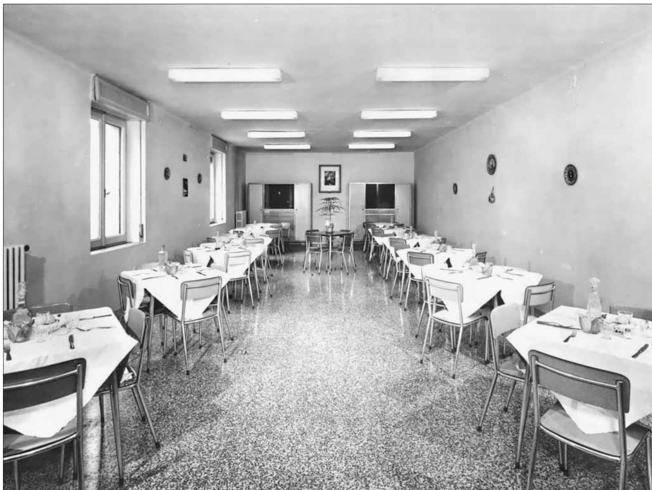
Mensa della Scuola Convitto