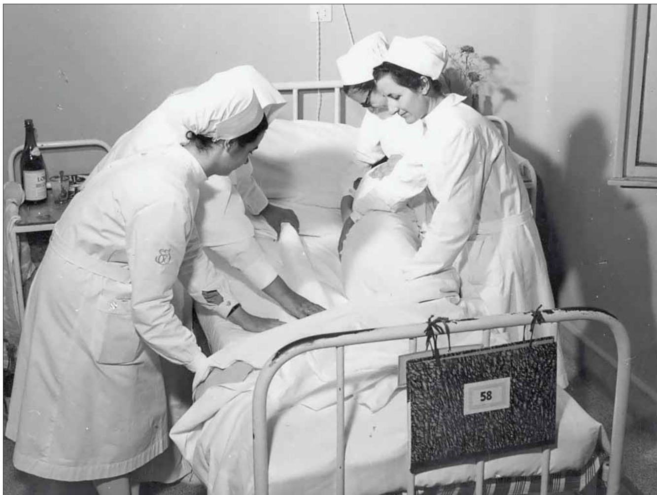
Rifacimento del letto occupato