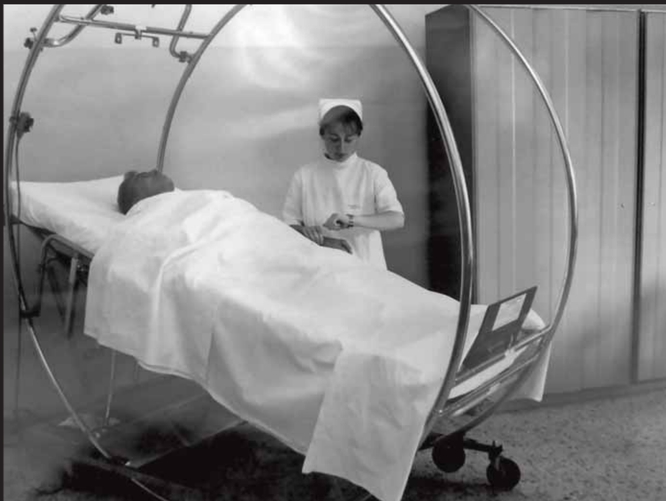
Letto a rotazione per paraplegici Stryker