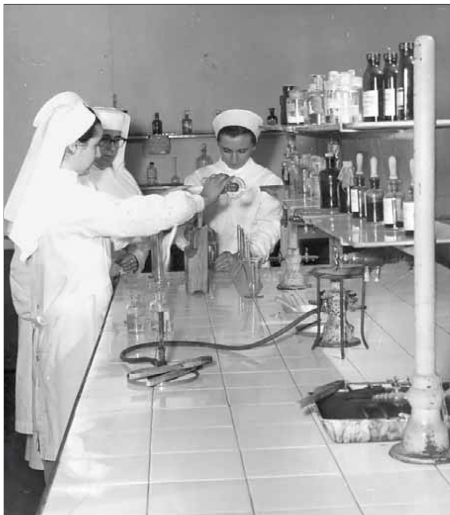
Laboratorio della Scuola Convitto