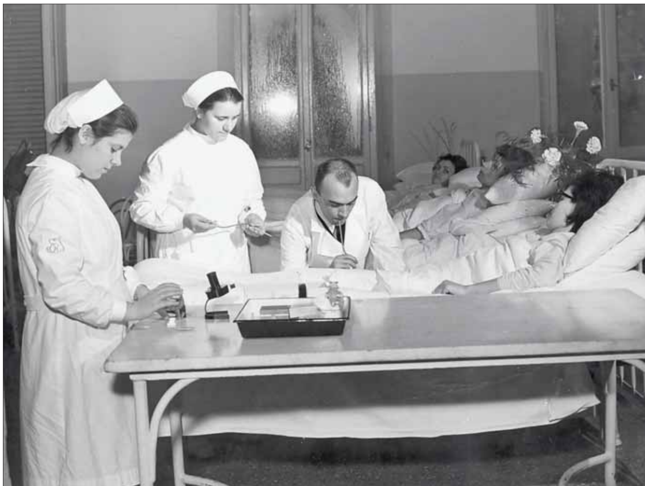
Attività diagnostica al letto del malato