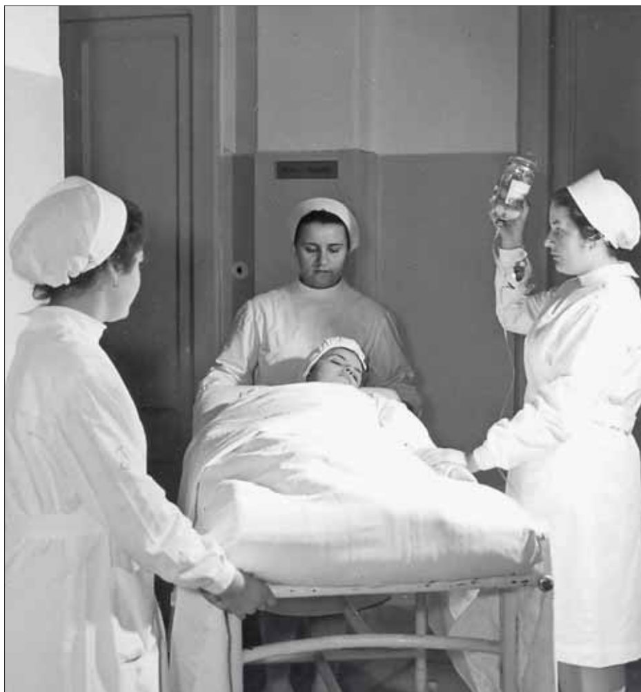
Trasporto del malato in Sala Operatoria