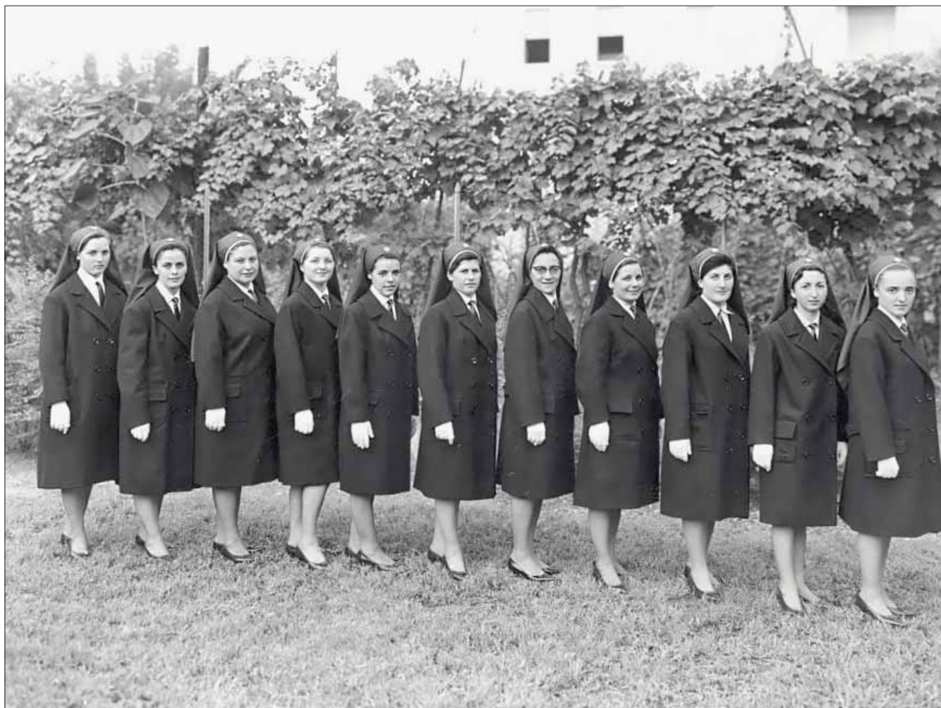
Allieve in uniforme di rappresentanza religiosa invernale