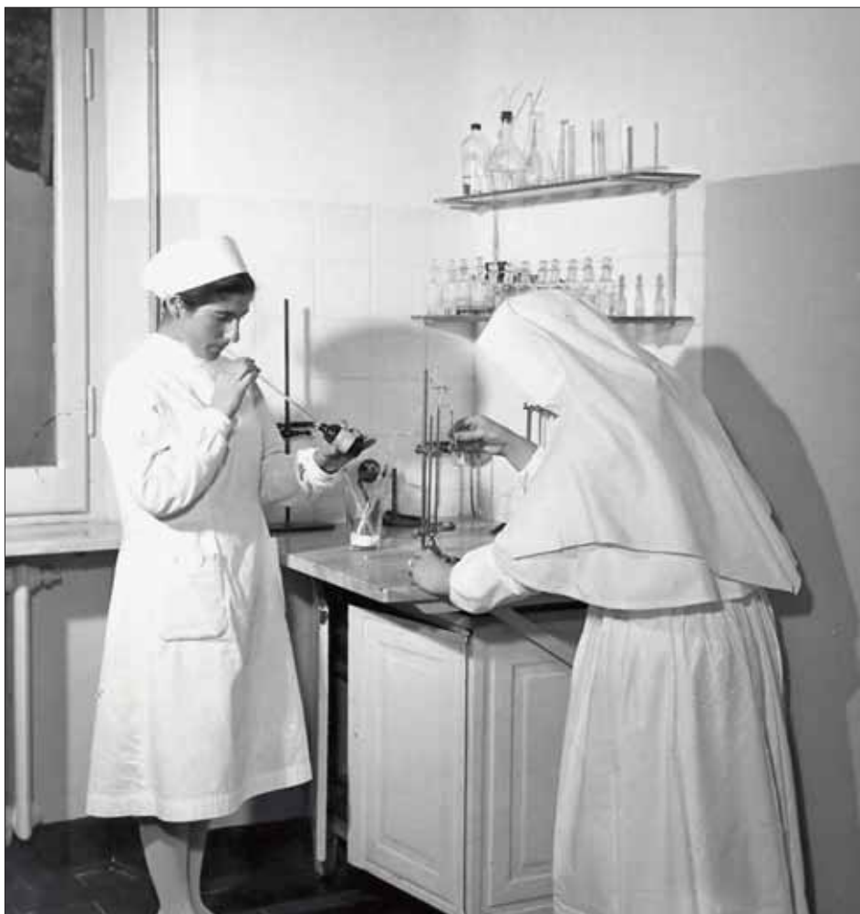
Ogni reparto era dotato di un piccolo laboratorio per: esami urine, sedimentazione, conteggio globuli rossi, VES