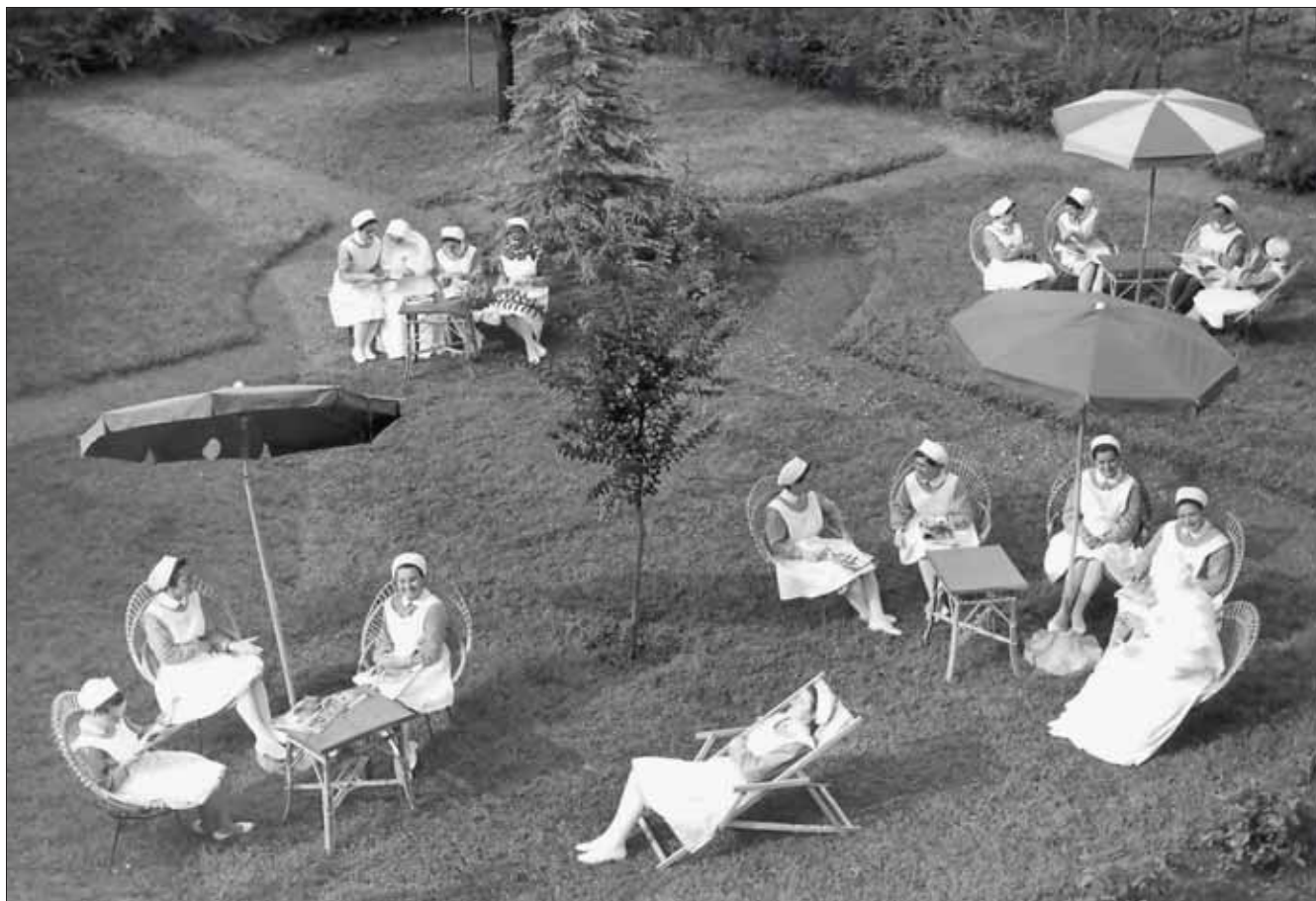
Giardino della Scuola Convitto