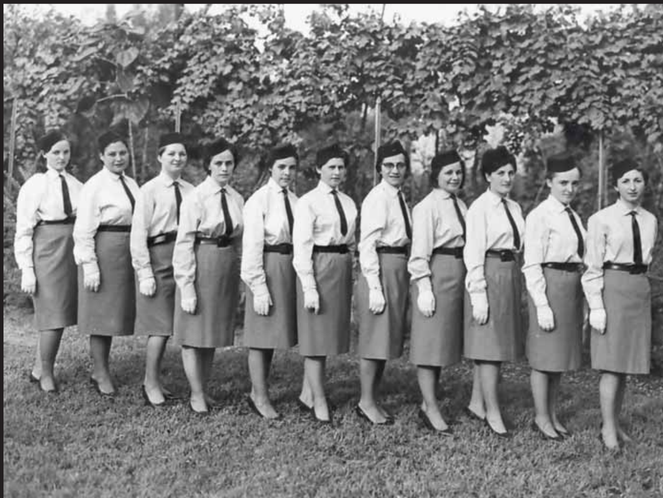
Allieve in uniforme di rappresentanza civile estiva