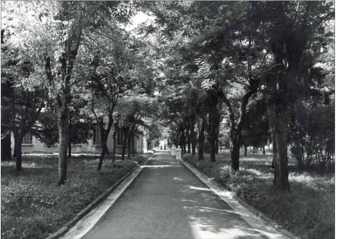
Viale interno del Policlinico San Matteo che conduce alla Scuola Convitto Professionale per Infermiere