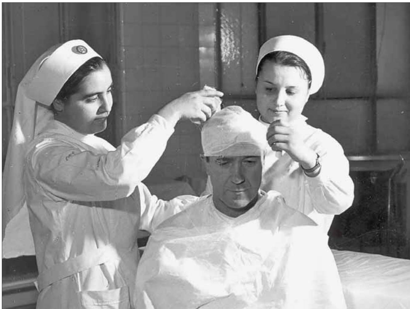
Fasciatura a berretto ippocratico