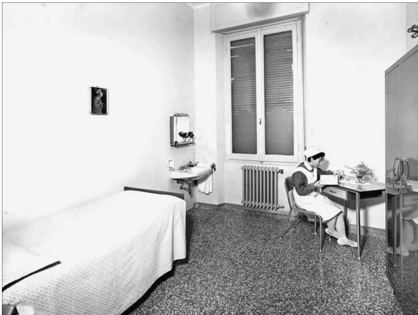
Studio individuale in una camera della Scuola Convitto