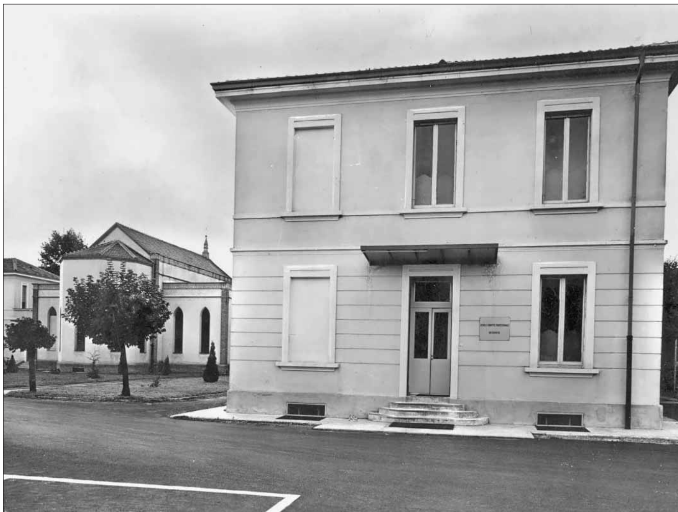
Sede della Scuola Convitto Professionale per Infermiere annessa all'Ospedale Policlinico San Matteo di Pavia