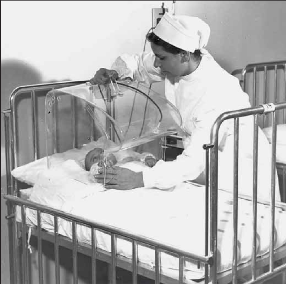
Assistenza al bambino con cappa per ossigenoterapia