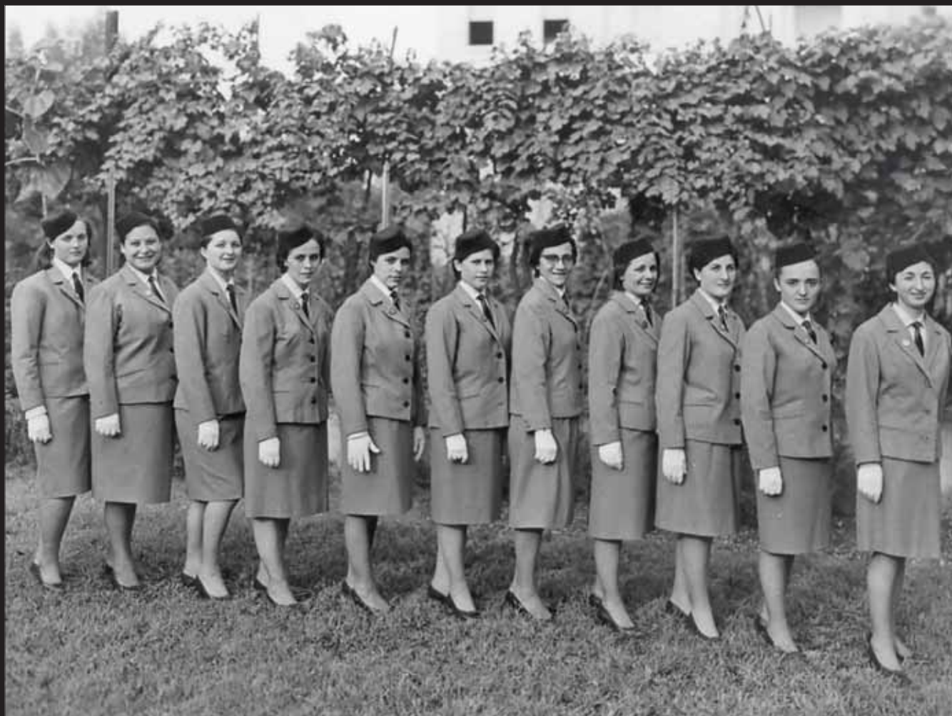
Allieve in uniforme di rappresentanza civile primaverile/autunnale