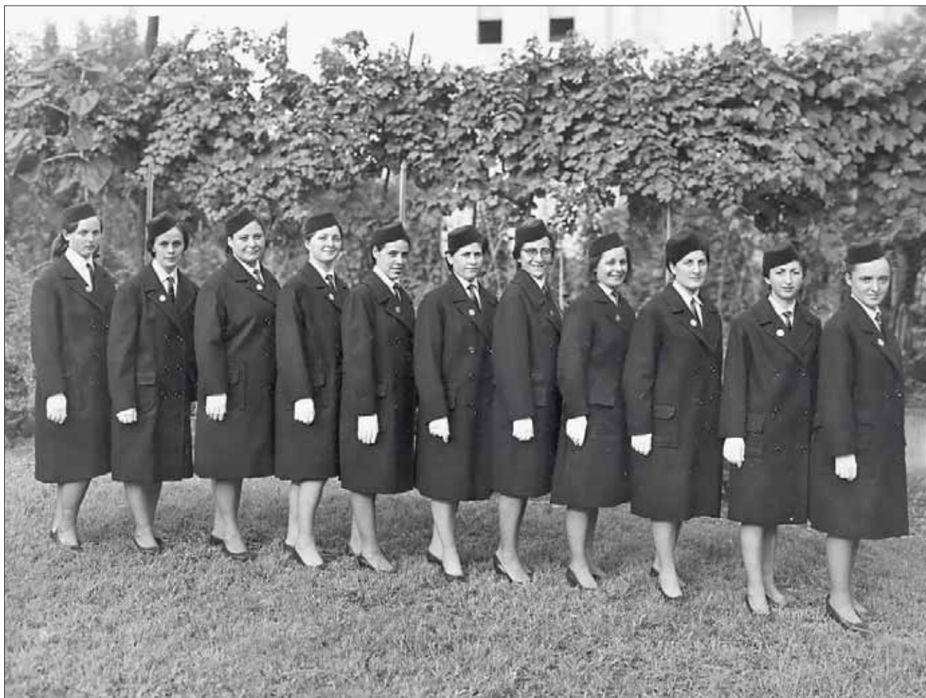
Allieve in uniforme di rappresentanza civile invernale