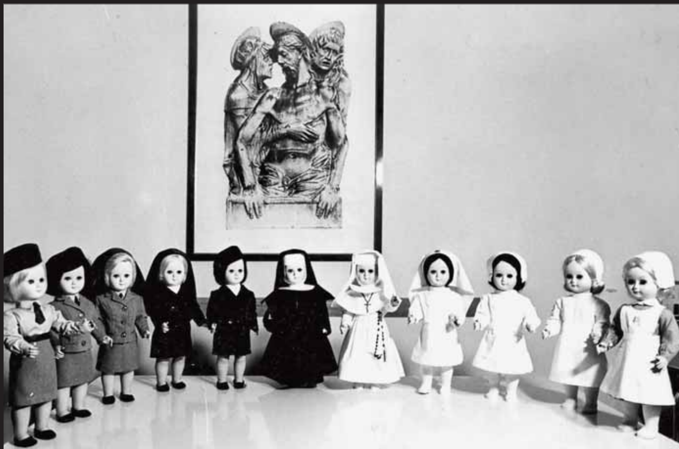
Modelli di Divise d'Ordinanza civili e religiose per la libera uscita e reparti