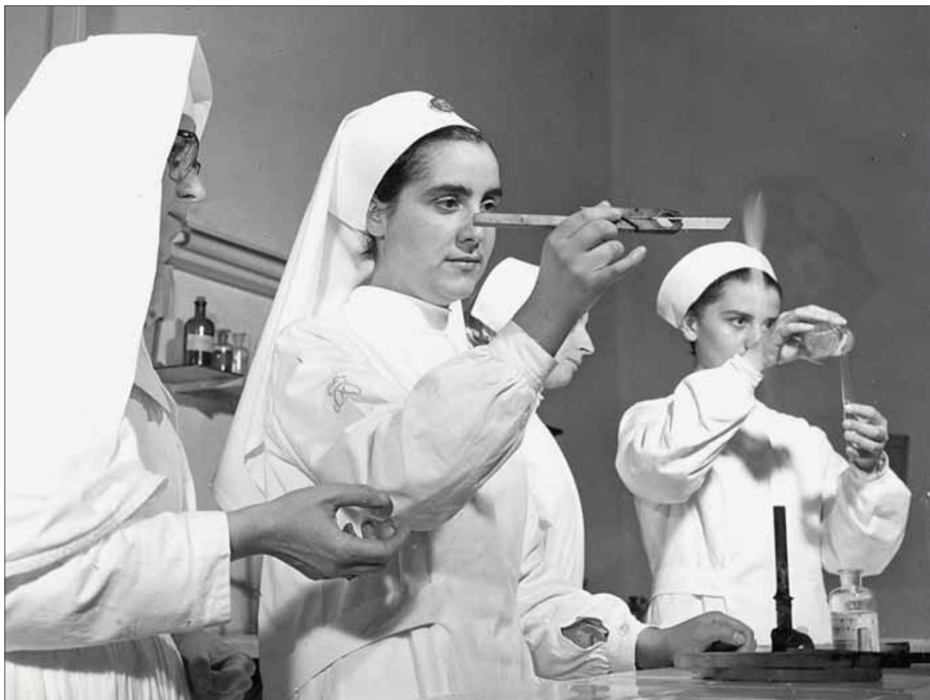
Attività di fissaggio striscia vetrino