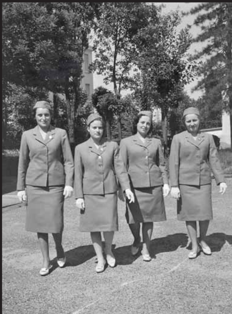
Primo gruppo di Allieve del I° e II° Anno Scolastico 1959/60