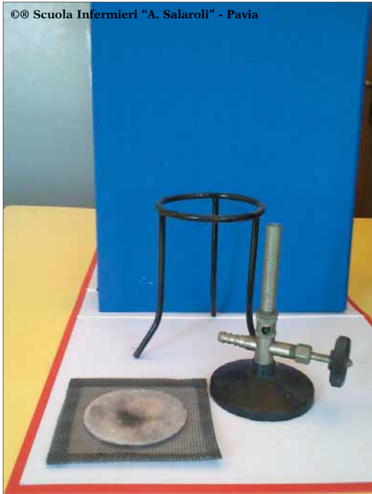
Il becco di Bunsen con il treppiede e reticella spargifiamma