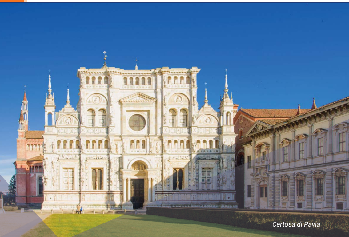
Certosa di Pavia

Clinica Pediatrica IRCCS Fondazione Policlinico San Matteo, Università Pavia