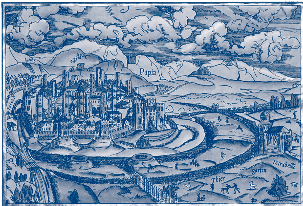
Mappa di Pavia, Sebastian Munster, 1550