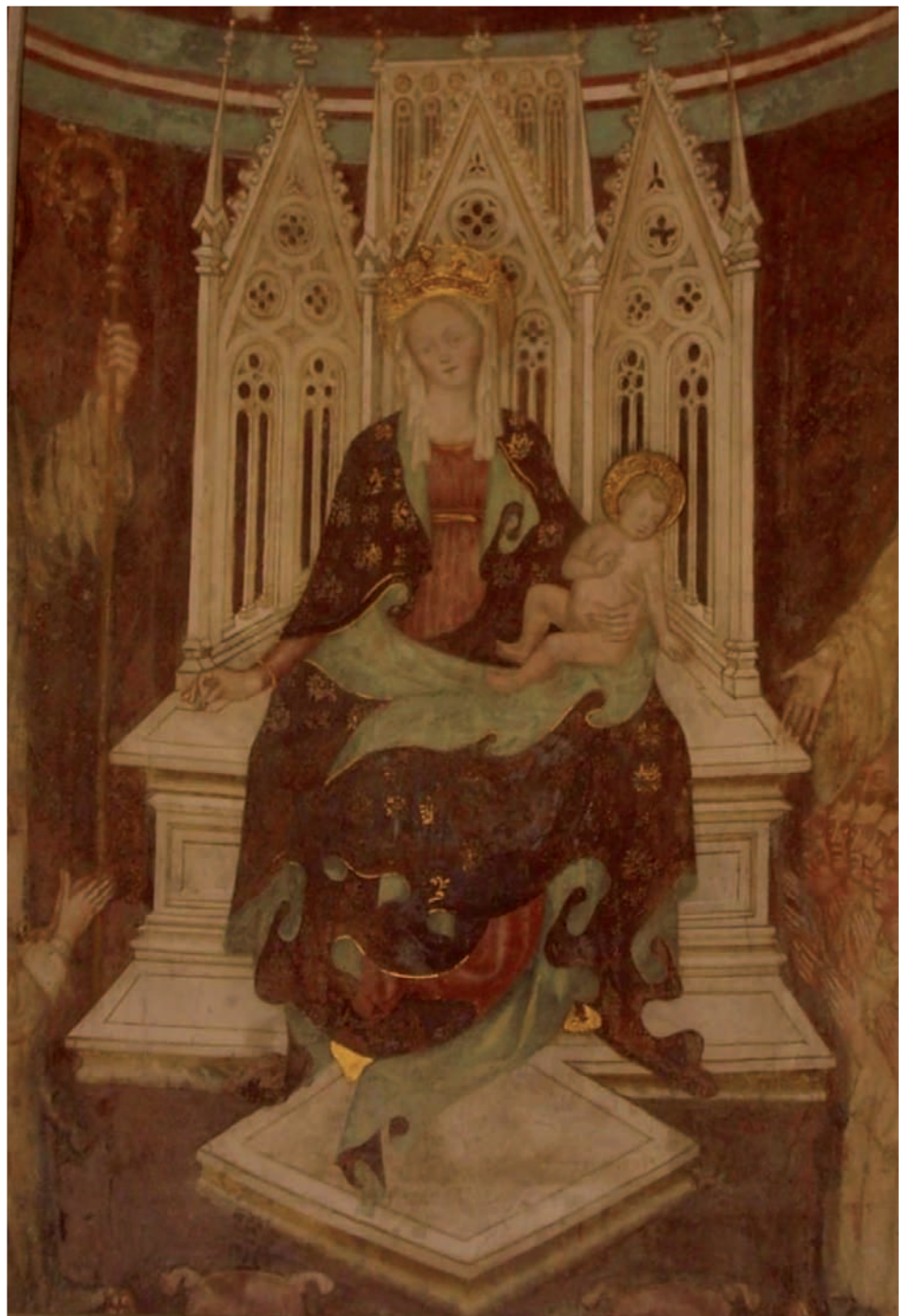
Madonna con Bambino in trono, affresco del XIV secolo, Scuola Lombarda, Chiesa di San Lanfranco, Pavia