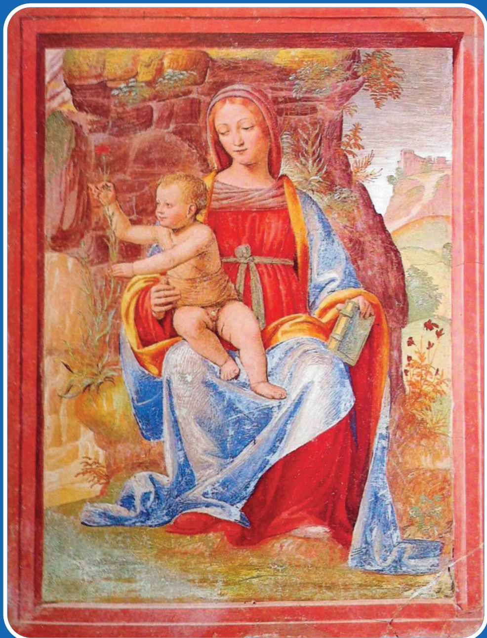
In copertina: Madonna del garofano Bernardino Luini, affresco del 1516, Certosa di Pavia