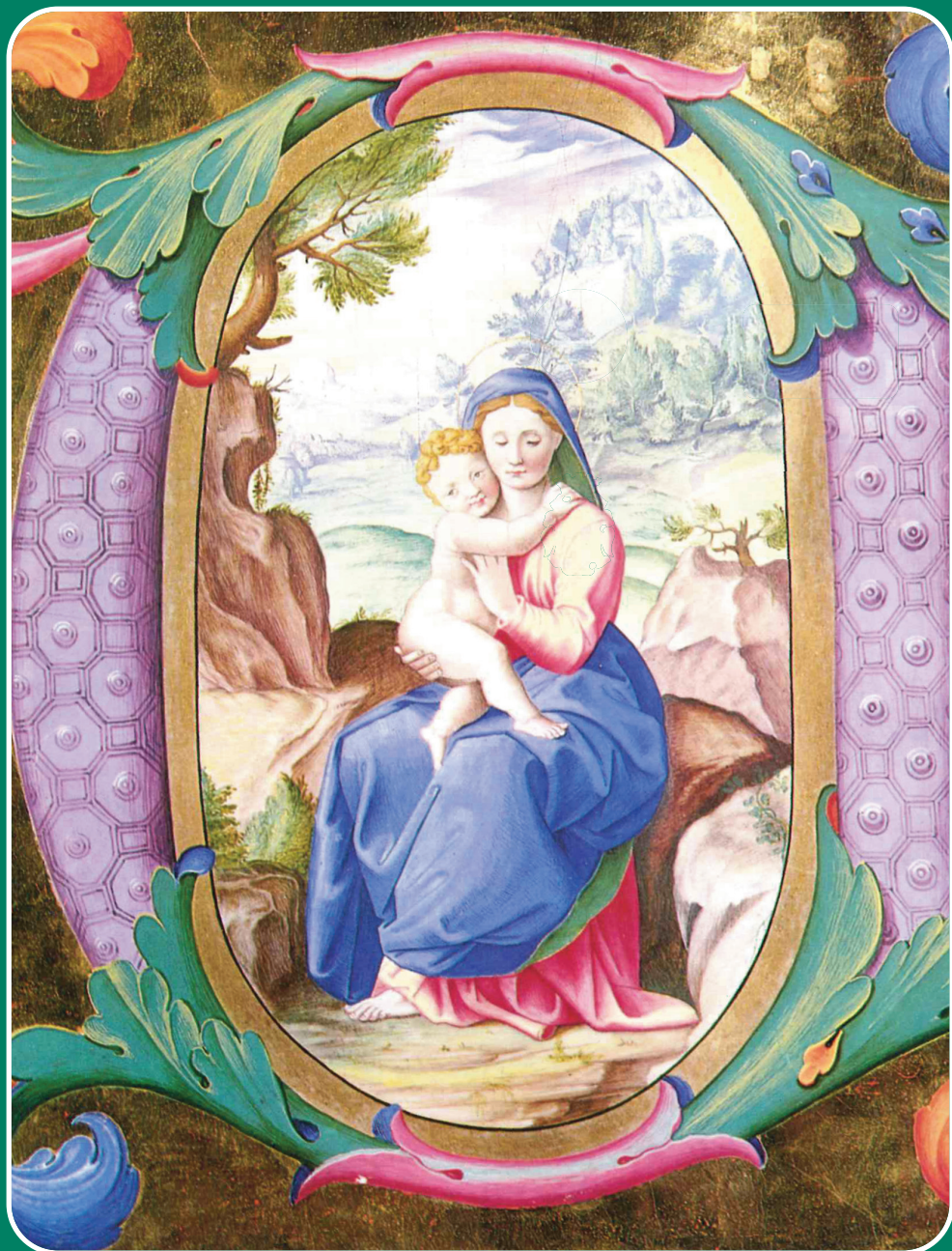
In copertina Madonna del Benedetto da Corteggia, Miniatura su pergamena, Certosa di Pavia